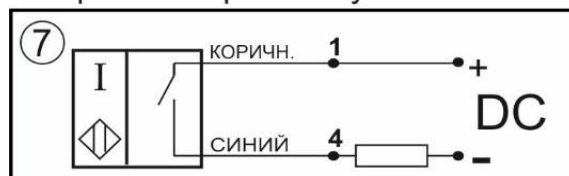
Цоколевка клеммной колодки